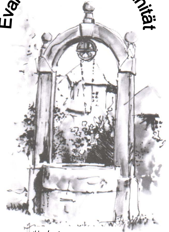
Illustration: M. Müntus